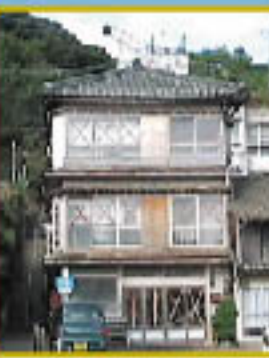
つたや旅館跡 昭和30年代、客船が発着していた頃全盛を極めた。現存する唯一の木造三階建て歴史的建造物。