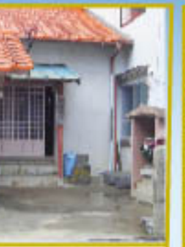
朝鮮通信使接待所跡 対馬から巻紙に着いた朝鮮使節一行をこの地で歓待した。現在は阿弥陀堂になっている。