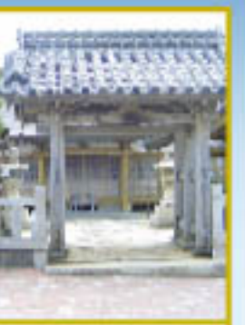
聖母宮 勝本浦町城主。この門は朝鮮正統と書かれている。神皇皇后の馬跡石は社務所儀。