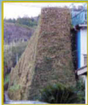
阿房塚 蘇で財を成した土肥家の栄華がしのばれる。3年かけて築いたという高さ7m、長さ90mもの雄大な石垣。