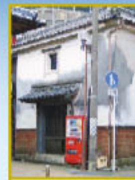
焼酎蔵本の土蔵 巻紙は支那産発祥の島。勝本浦にも3軒の蔵本があった。旧豊川酒造と源田酒造の土蔵が現存する。