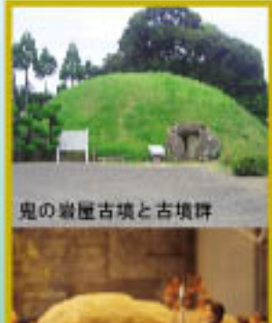
鬼の岩屋古墳と古墳群