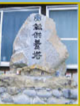
永取家跡 永く船を運ぶようにと甲斐の殿様から「永取」を拝命し、勝本輪船の頭として隆盛を極めた永取家。