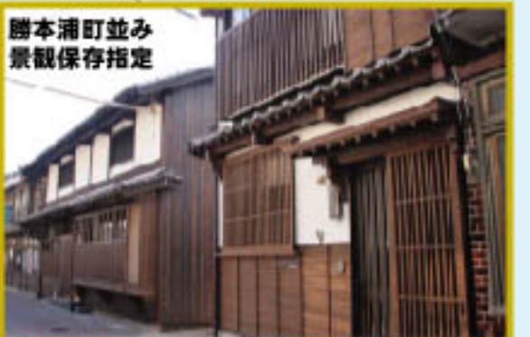
勝本浦町並み景観保存指定