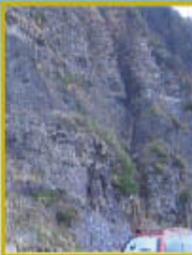
隆起古代地層 岩板の島の土台になっている古代地層が隆起によって地表に現れている。見事な縞模様の崖。